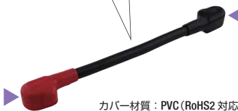
カバー材質：PVC (RoHS2 対応)